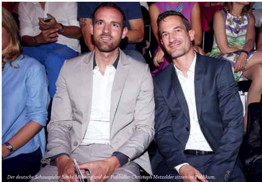
Der deutsche Schauspieler Sönke Möhring und der Fußballer Christoph Metzelder sitzen im Publikum.