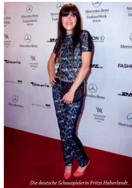
Die deutsche Schauspielerin Fritzi Haberlandt.