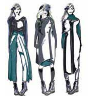
KATY CLARK SUNDAY DESPERADOS

Die britische Designerin tauschte sich mit den Finalisten zu deren Modeideen und dem Förderprogramm, das auf die Gewinner wartet, aus: „Der Anspruch einer nachhaltigen Unterstützung hat mich beim DfT besonders überzeugt, denn Erfolg stützt sich nicht nur auf Kreativität, sondern auch darauf, zu verstehen, wie das Business funktioniert.“