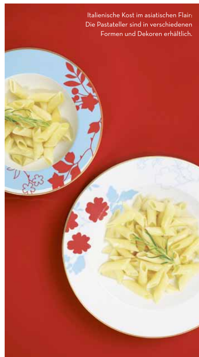
Italienische Kost im asiatischen Flair: Die Pastateller sind in verschiedenen Formen und Dekoren erhältlich.