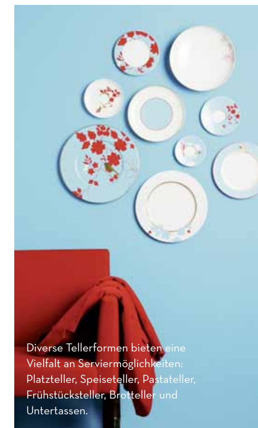
Diverse Tellerformen bieten eine Vielfalt an Serviermöglichkeiten: Platzteller, Speiseteller, Pastateller, Frühstücksteller, Brotteller und Untertassen.