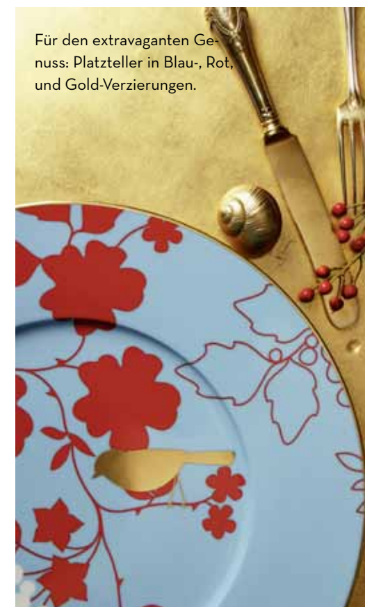
Für den extravaganten Genuss: Platzteller in Blau-, Rot- und Gold-Verzierungen.