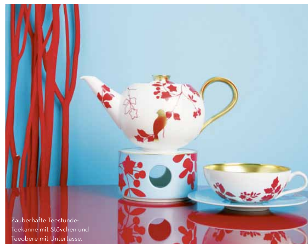
Zauberhafte Teestunde: Teekanne mit Stövchen und Teeobere mit Untertasse.