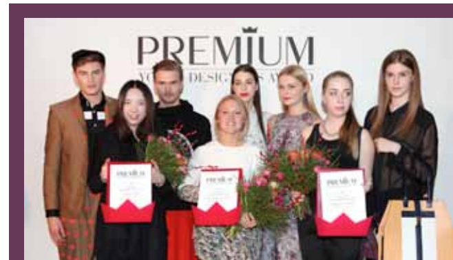
Die Gewinner des PREMIUM Young Designers Award H/W 2014/15 mit den Models, die die Kollektionen präsentieren (Von links nach rechts): Menswear: Na Di Studio/London; Womenswear: Louise Körner by MUUSE/London; Accessories: Hemsley London / London.